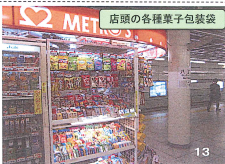
店頭の種類菓子包装袋 13